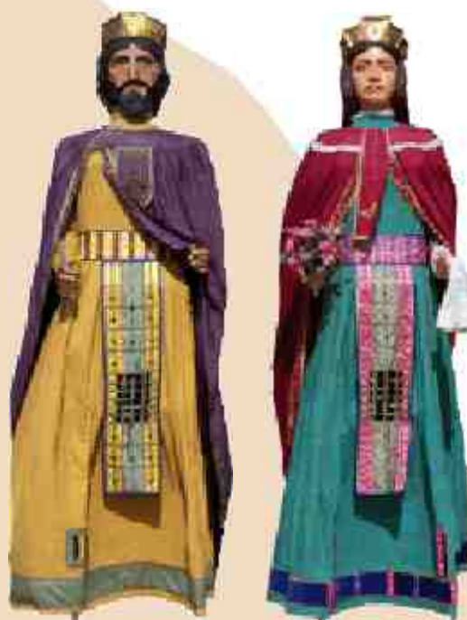
Justinià i Teodòsia